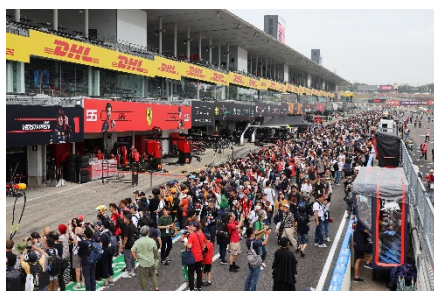
「木曜ピットウォークの様子」 (2023年F1日本グランプリ)