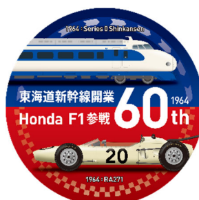
缶バッジ(イメージ)