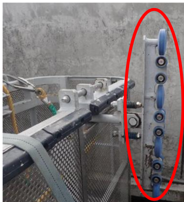
破損したローラー部分 （正常状態）

※ゴンドラに取り付けられているローラーは、1箇所につき、直径75mm（重さ90g）が4個、直径35mm（重さ10g）が12個。