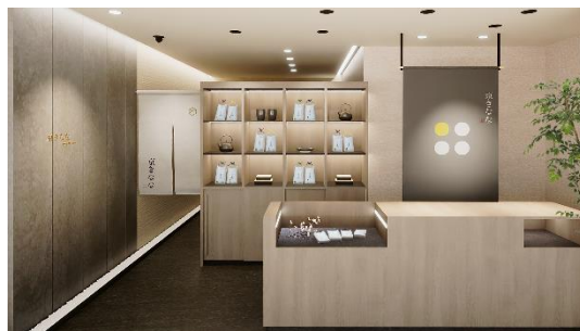
店舗外観イメージ