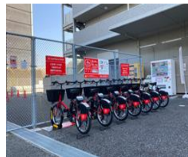
ポート設置場所 JR ゲートタワー1階 東側（赤枠・赤色色部分）