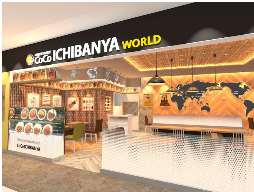
店舗外観イメージ