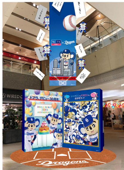
『ドアラエリア』@ゲートタワープラザレストラン街12F