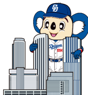
ビルとドアラのコラボイラスト