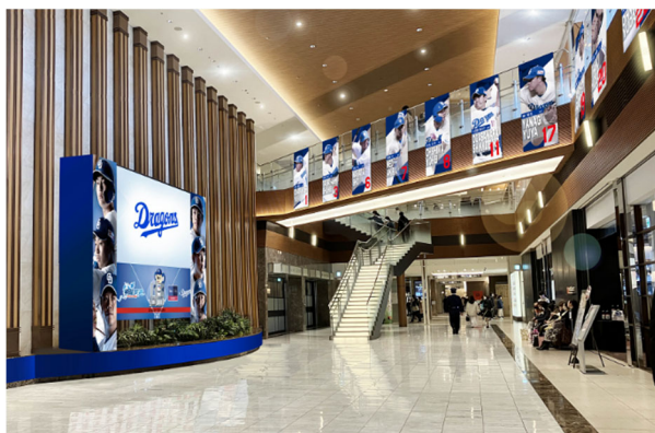
『選手エリア』@タワーズプラザレストラン街12F