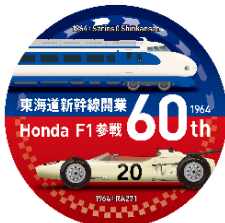
1964 東海道新幹線 0 系 × Honda RA271