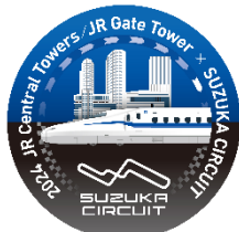
JR セントラルタワーズ・JR ゲートタワー × 鈴鹿サーキット