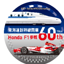
2007 東海道新幹線 N700 系 × SUPER AGURI Honda SA07