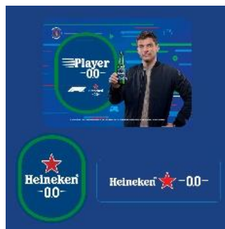
特製ノベルティ （ステッカー）