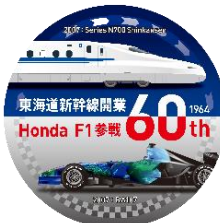
2007 東海道新幹線 N700 系 × Honda RA107