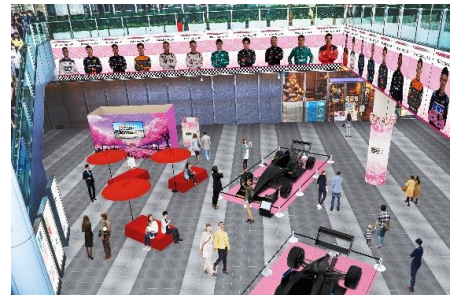
イベント会場（イメージ）