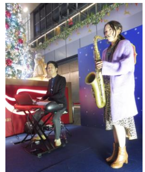
< 昨年の開催の様子 >