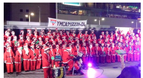
<クリスマスキャロル (過去開催の様子)>

イベントの概要は、 当社ホームページ http://www.towers.jp/ で随時ご紹介します。