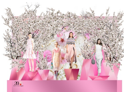
(株)ジェイアール東海高島屋

「BLOOMING TOWERS」をテーマに20周年特設広場において、緑の芝生の上を咲き誇る花々と、宙を舞う蝶々が憩いの場として皆様をお出迎えます。週末は各社イベントが開催されます。