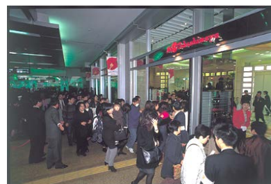
開業当日のタカシマヤの様子