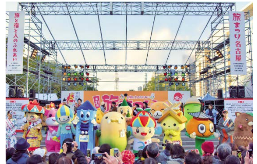
旅まつり名古屋 2019の様子