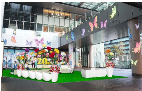
ジェイアールセントラルビル(株)

タワーズが全面開業20周年を迎えたことを機に、ジェイアールセントラルビル株式会社、株式会社ジェイアール東海高島屋、株式会社ジェイアール東海ホテルズの3社において、それぞれにテーマを設けて特別な装飾を実施します。