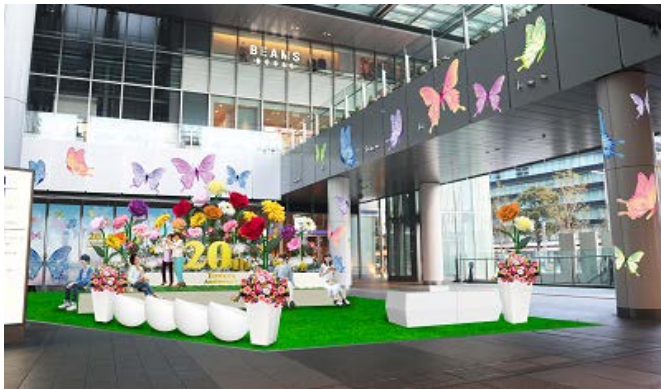
<1階イベントスペースにおける装飾>