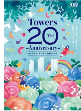
<20周年ポスタービジュアル>