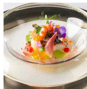
特別メニュー前菜 「20種類の素材の宝石箱」

さらに20周年記念特別プランとして、先着100組に披露宴人数50名で200万円のプランや、20種類の素材を使った前菜と、オリジナルのデザートを含んだフランス料理の特別メニューもご用意します。