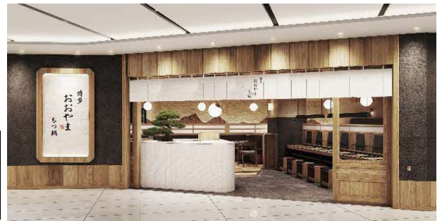
店舗外観イメージ